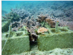
移植先のリュウキュウキッカサンゴ (今は、泥をかぶって劣化している)