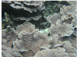
1区埋立地に生息していたリュウキュウキッカサンゴ (今、浚渫土砂で生埋め)